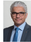
Ashok Sridharan Oberbürgermeister der Stadt Bonn